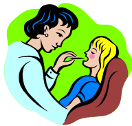
bolest v krku